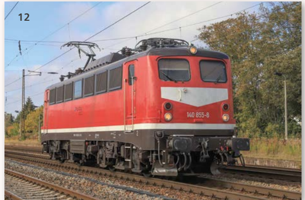
Abb. 12: Die Ellok 140 855-8 der Triangula Logistik GmbH (TRG) bei Leipzig-Wiederitzsch

Mit diesem Set erhalten Sie die Ergänzung des Arriva-Sets aus 2025 mit dem vierten und fünften Doppelstockwagen, den es beim "alex" gegeben hat. ■