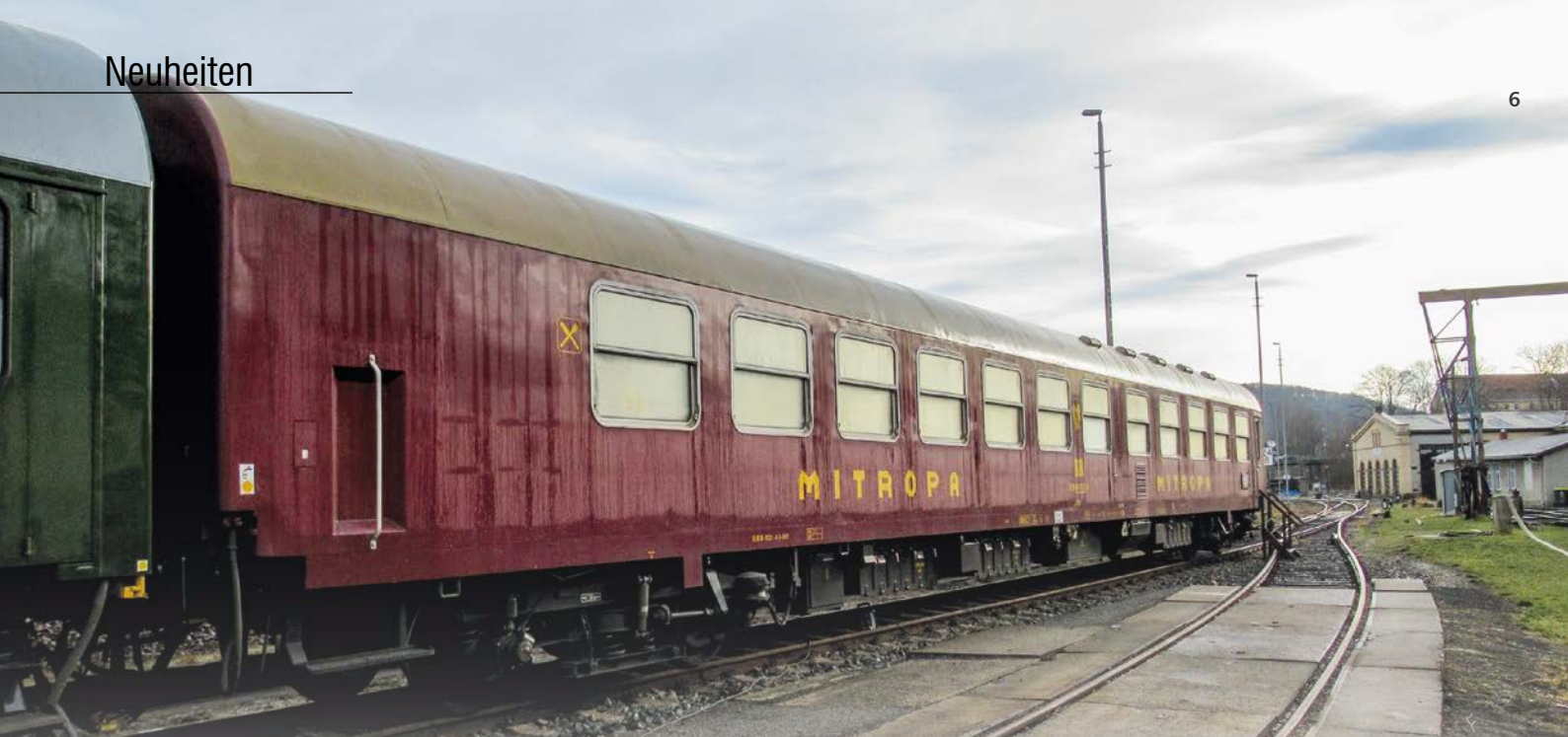
Abb. 6: Speisewagen der OSEF.