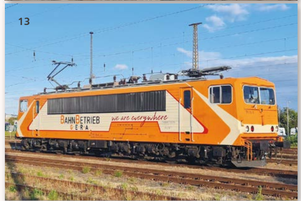
Abb. 13: Ellok 155 111-8 "Bahn-Betrieb Gera".