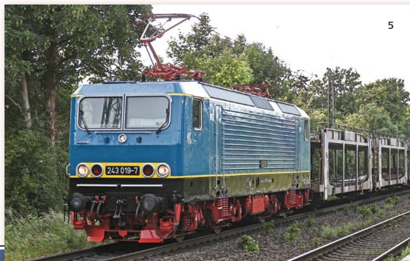
Abb. 5: Die 243 019 der WFL bei Rinkerode im Juni 2025 (Foto: Stefan Klein).